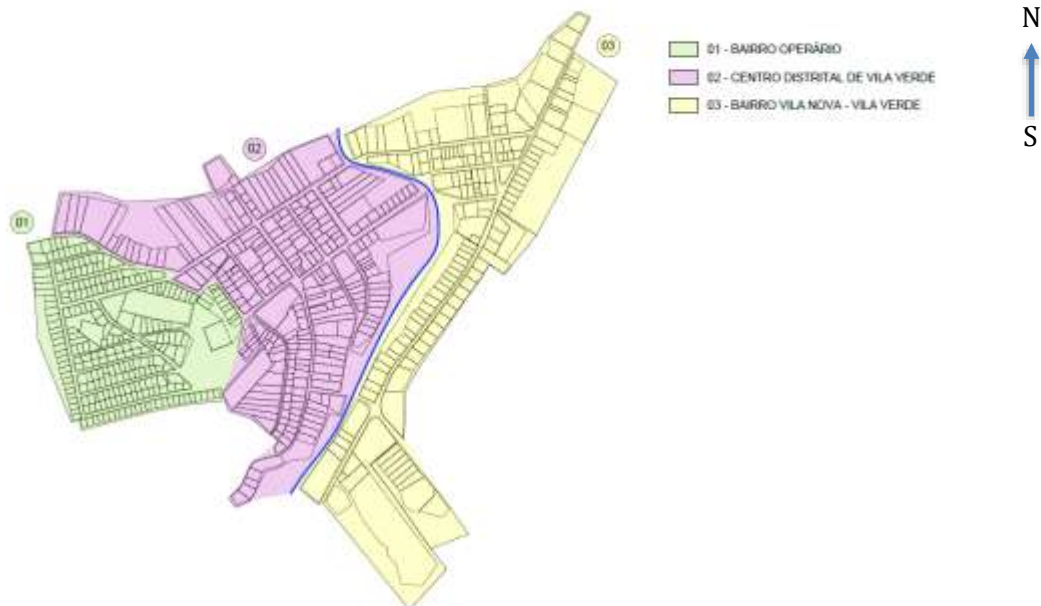
MAPA DO DISTRITO DE VILA VERDE - DELIMITAÇÃO DE BAIRROS