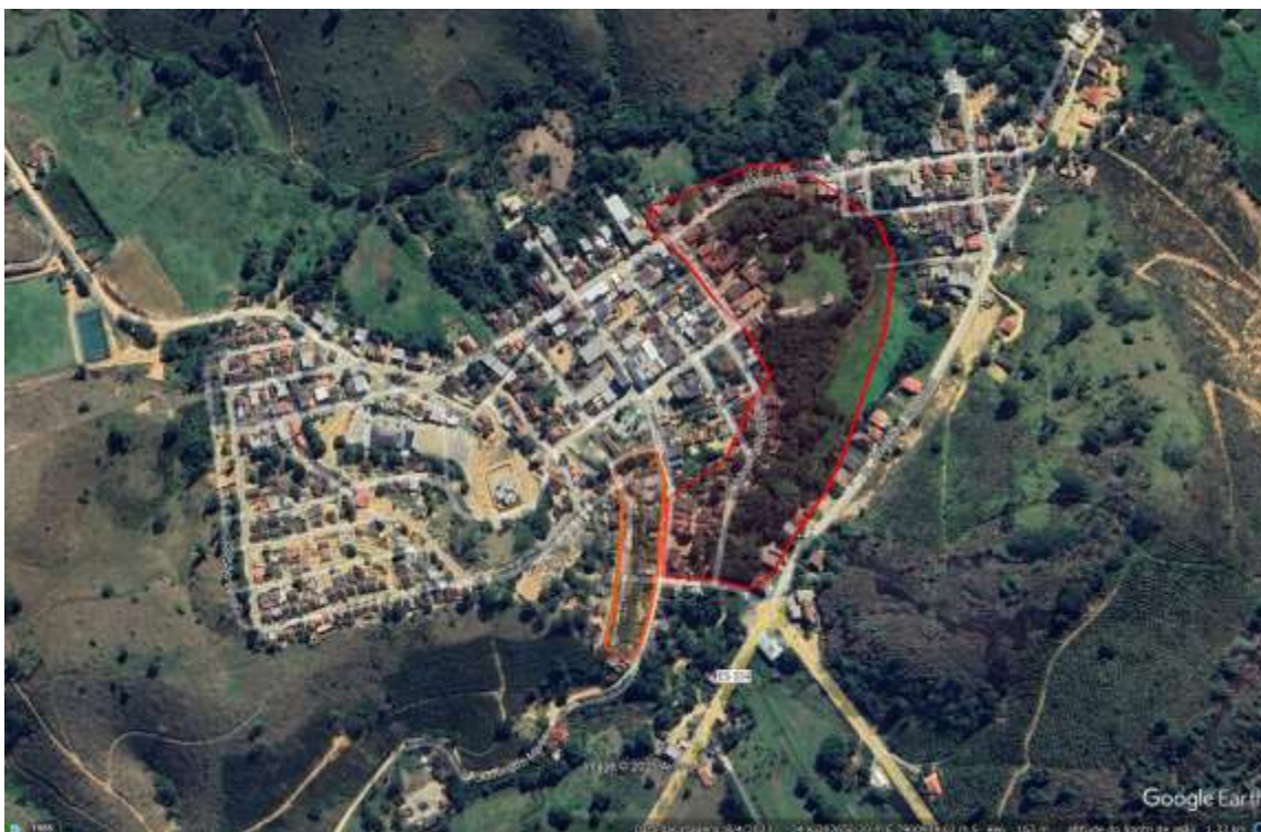
Figura 2 - Setores de Risco de Vila Verde, distrito de Pancas, mapeadas pelo CPRM em 2013

Em setembro de 2024, após solicitação do município, foi realizado novo mapeamento, onde a cidade passou a ter 25 setores de riscos, sendo 21 na sede do município e 04 no distrito de Vila Verde. Mais uma vez, Laginha não teve áreas mapeadas como sendo de risco.