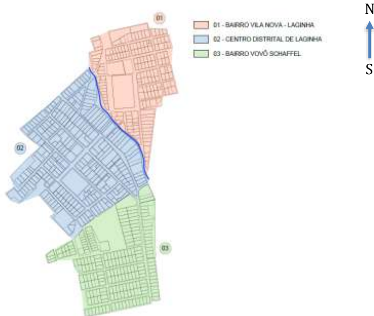
MAPA DO DISTRITO DE LAGINHA - DELIMITAÇÃO DE BAIRROS