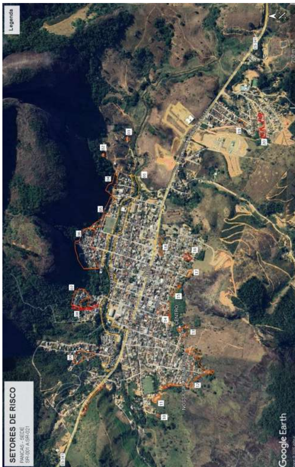
Figura 3 - Setores de Risco Mapeados na sede de Pancas pela SGB em 09/2024