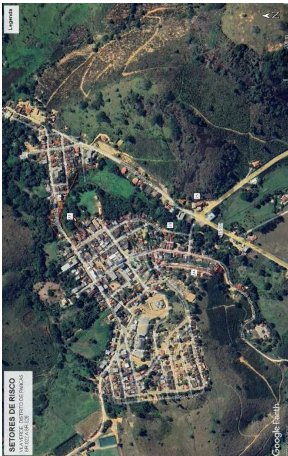
Figura 4 - Setores de Risco Mapeados no distrito de Vila Verde pela SGB em 09/2024