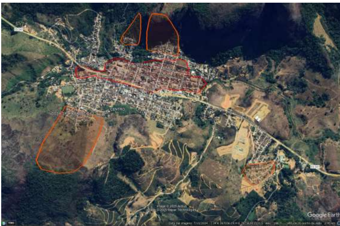
Figura 1 - Setores de Risco da Sede de Pancas, mapeadas pelo CPRM em 2013

Após os desastres ocorridos por conta da grande enchente de 2013, o CPRM mapeou a cidade com 05 áreas de riscos na sede do município, e 02 áreas de riscos em Vila Verde, distrito de Pancas. Laginha, também distrito de Pancas, não foi mapeada nenhuma área como sendo de risco.