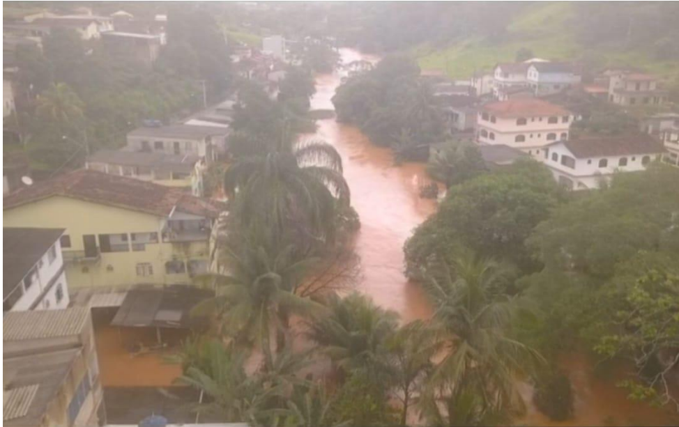
Imagens aéreas do Rio Fundão - Margens da Rod. Eng. Josil Espindula Agostini - Beira Rio