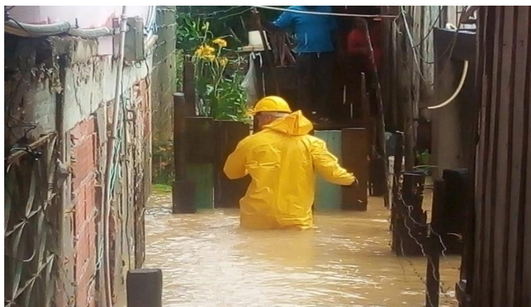
Defesa Civil realizando a retirada das famílias ilhadas - Rua Cesar Poletti