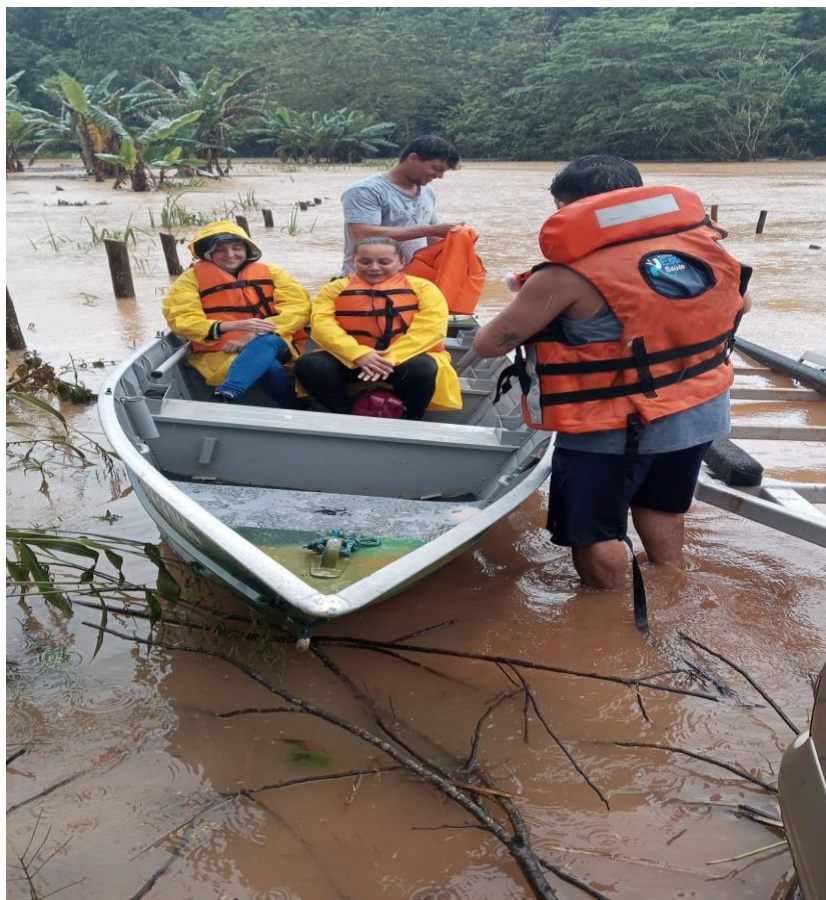
Atendimento de Equipe médica em áreas isoladas (zona rural) com apoio da Defesa Civil