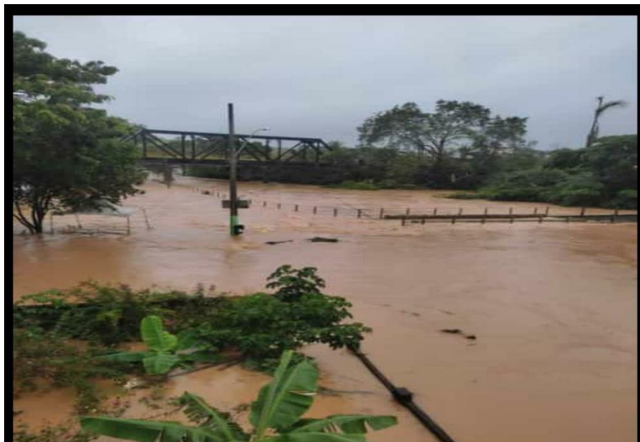
Imagens aéreas da Ponte sobre o Rio Fundão - Ponte que dá acesso aos bairros: Orly Ramos e Santo Antônio (ano:2022)

DAS VULNERABILIDADES DAS ÁREAS DE RISCO, DA PREPARAÇÃO PARA EMERGÊNCIA, RESPOSTA, SOCORRO, ASSISTÊNCIA E RECONSTRUÇÃO DOS CENÁRIOS DE DESASTRES, EM SITUAÇÃO ANORMAL NO MUNICÍPIO DE FUNDÃO – ES.