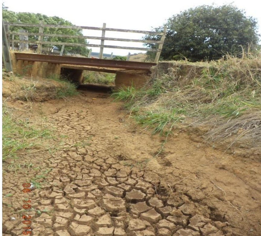
Imagem período da seca Fundão-ES

Está relacionada com a distribuição das precipitações pluviométricas e dos recursos naturais, principalmente de água, por isso, não ocorre de forma súbita e depende em grande medida da demanda de água que existente na região.