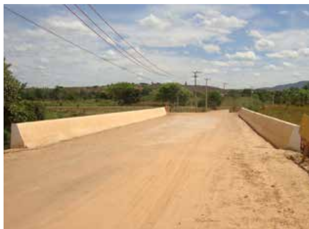
Figura 10. Ponte reconstruída sobre o rio Batateira, no ano de 2014. Crato/CE