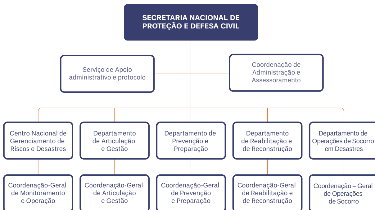
Figura 6. Estrutura da Secretaria Nacional de Proteção e Defesa Civil. Fonte: Decreto nº 8980, de 01 de fevereiro de 2017.