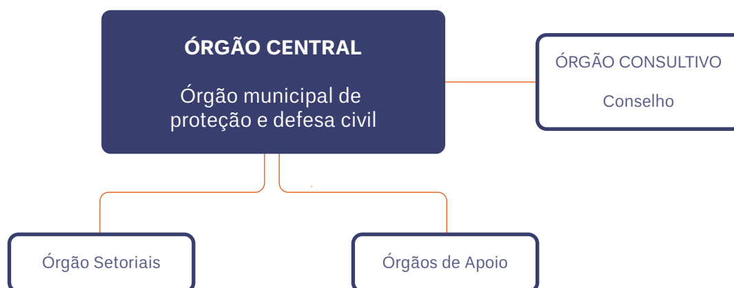
Figura 2. O Sistema Nacional de Proteção e Defesa Civil – SINPDEC.

Estabelece ainda uma abordagem sistêmica para a gestão de risco, dentro das ações de prevenção, mitigação, preparação, resposta e recuperação. Como abordagem sistêmica deve-se considerar que as ações possuem relação entre si, e jamais ocorrem de maneira isolada. Ou seja, mesmo em momentos de recuperação, por exemplo, a perspectiva da prevenção deve estar presente. É a isto que se refere o Marco de Sendai quando menciona a máxima “Reconstruir Melhor que Antes”.