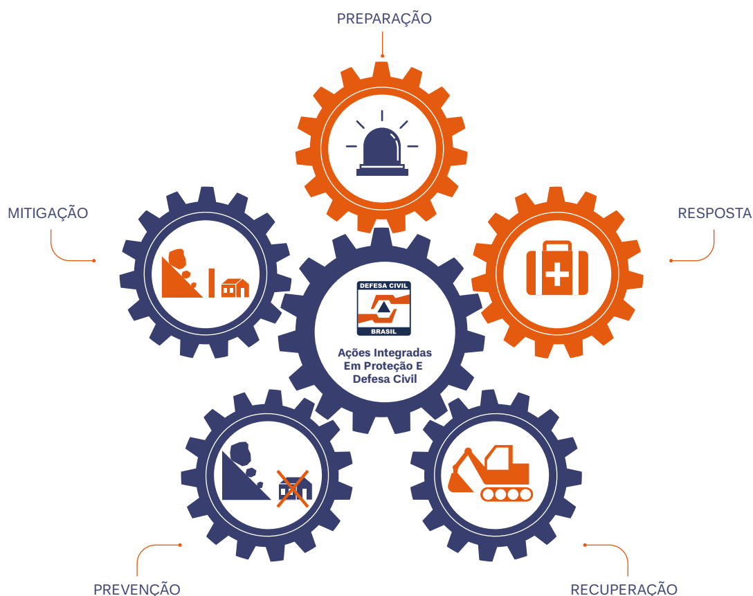
Figura 5. Gestão Integrada em Proteção e Defesa Civil.

análises de quatro desastres em Pernambuco, Alagoas, Santa Catarina e Rio de Janeiro, com essa metodologia.