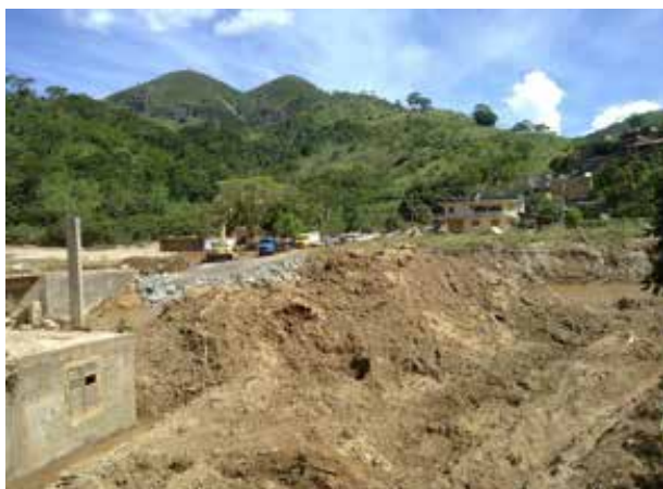
Figura 9. Restabelecimento de aesso em Bom Jardim, RJ, 2011.