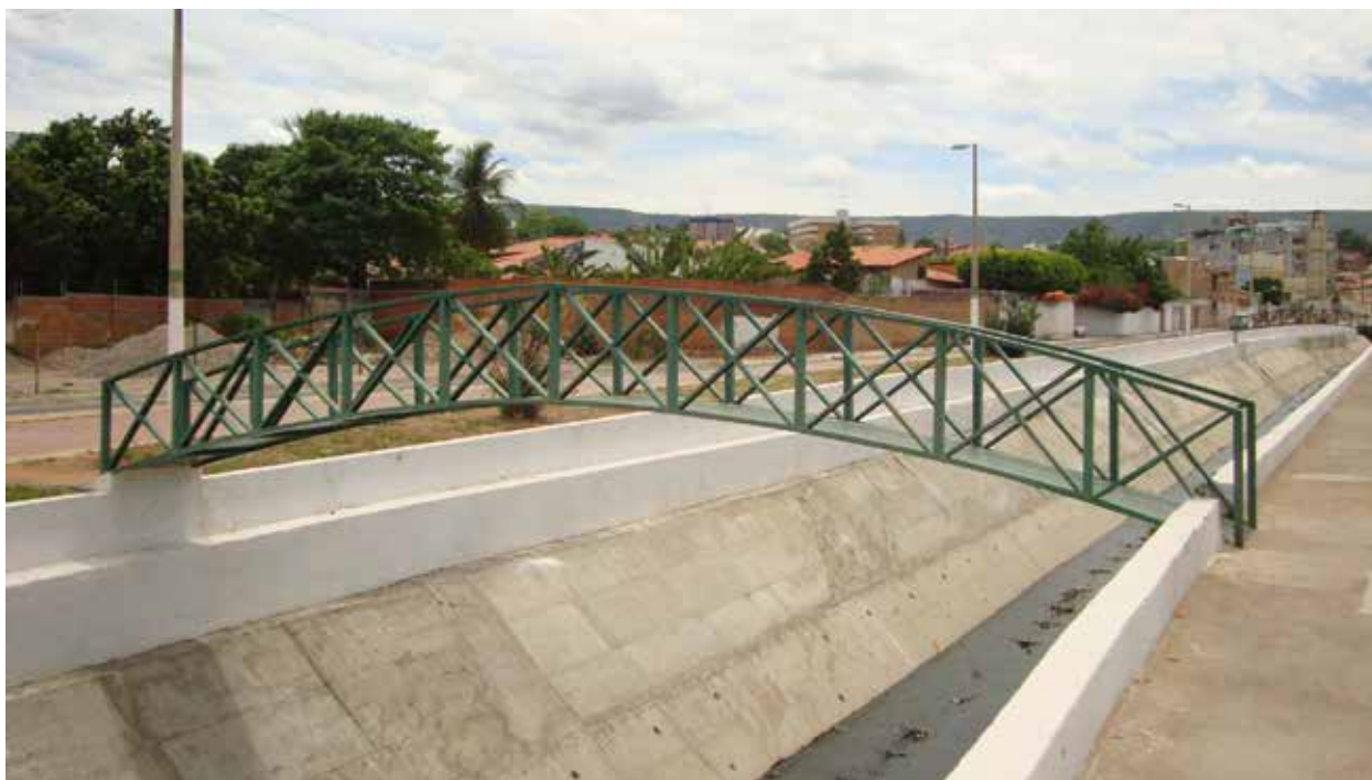
Figura 4. Passarela metálica reconstruída sobre o canal do rio Granjeiro, em 2014, na cidade de Crato/CE.

A ocorrência de desastres deixa um rastro de sofrimento humano, aflições e mortes. Depois do desastre, mesmo com o atendimento emergencial, socorro e assistência bem como o restabelecimento dos serviços essenciais, é necessário recuperar as condições de normalidade nos locais atingidos. Para isso, são necessárias medidas destinadas à recuperação social, econômica e ambiental, e também a reconstrução da infraestrutura, das edificações e seus sistemas integrantes, em caráter definitivo.