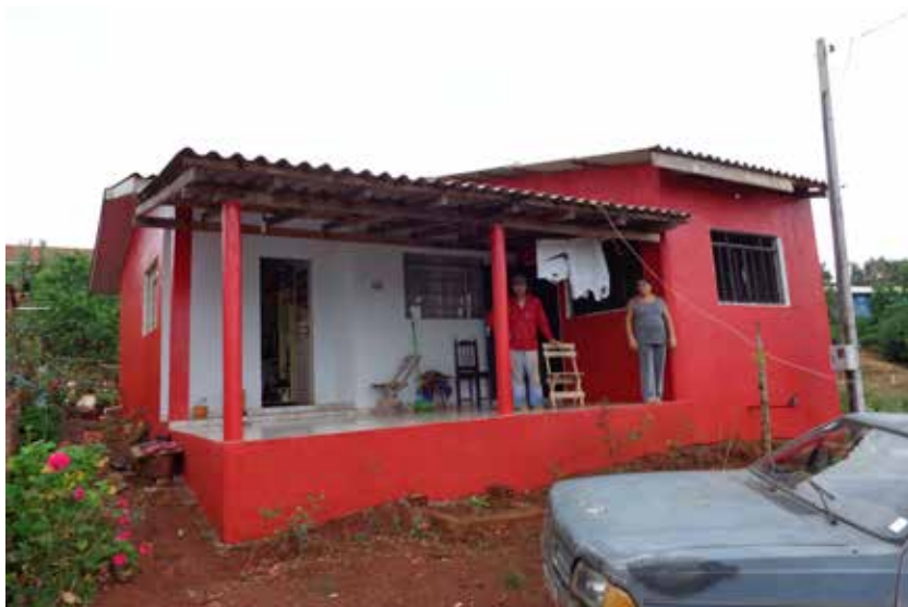
Figura 11. Exemplo de reconstrução de unidade habitacional no município de Matelândia/PR, 2013.

A SEDEC/MI tramita a documentação para o Ministério das Cidades, mas quem acompanha o processo naquele ministério é o ente requerente.