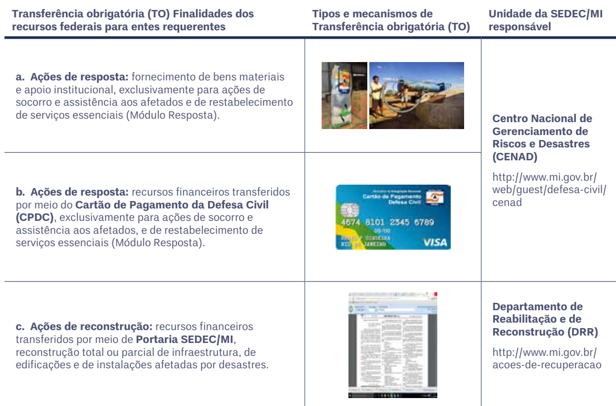
Quadro 1. Resumo das transferências obrigatórias destinadas à resposta e à reconstrução