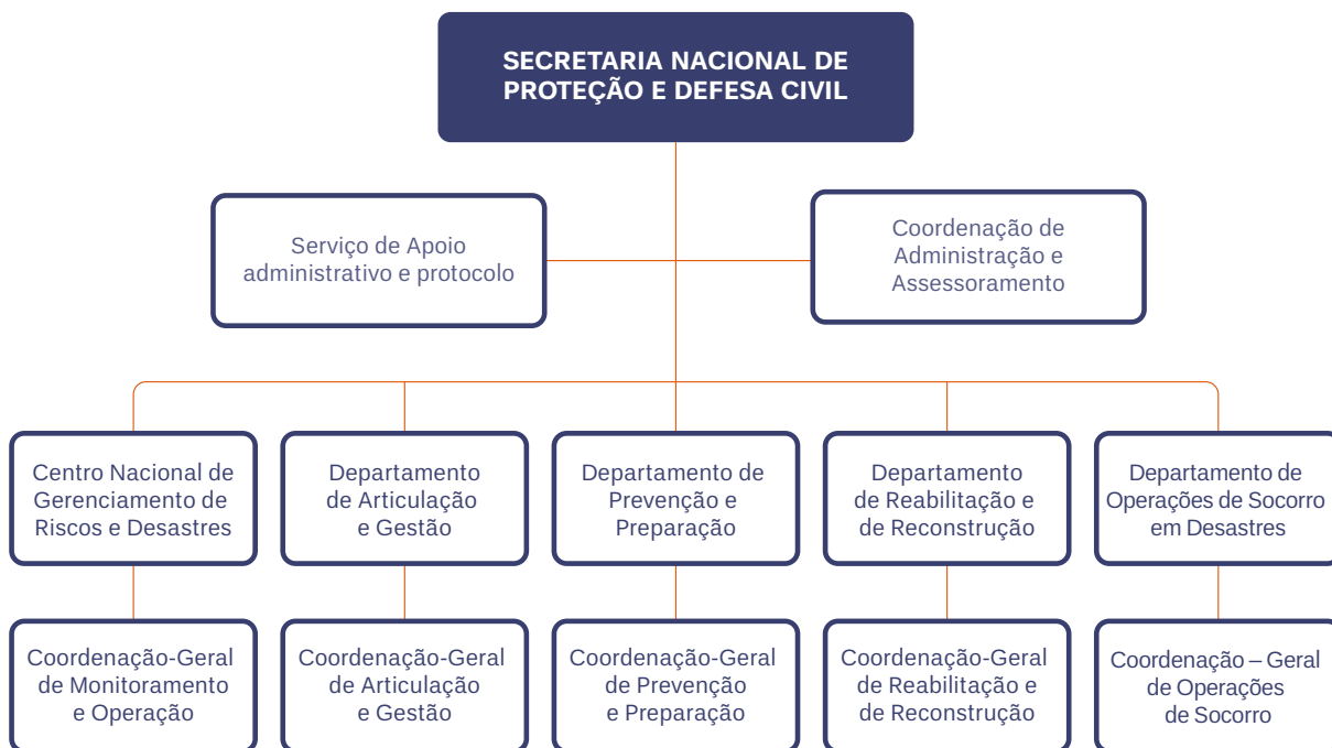
Figura 3. Estrutura da Secretaria Nacional de Proteção e Defesa Civil. Fonte:Decreto nº 8980, de 01 de fevereirode 2017.

organizam sua área de proteção e defesa civil dentro da administração pública local. Assim, há locais em que esses órgãos se constituem em secretarias específicas, e outros em que se integram à estrutura de outras secretarias ou ao gabinete do prefeito, por exemplo. Independente da forma, Estados e Municípios devem responder pelas competências definidas em lei.