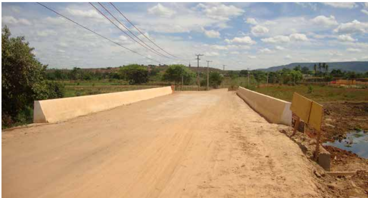
Figura 8. Ponte reconstruída sobre o rio Batateira, no ano de 2014. Crato/CE

Após o desastre, tão logo o atendimento emergencial esteja sob controle, o ente requerente, por meio do seu órgão de proteção e defesa civil, contando com a participação dos demais órgãos do SINPDEC local, deverá dar início à recuperação, principalmente planejando a reconstrução, pois demanda-se tempo para o diagnóstico da infraestrutura (edificações e instalações) danificadas e destruídas e para o desenvolvimento de anteprojetos ou projetos básicos.